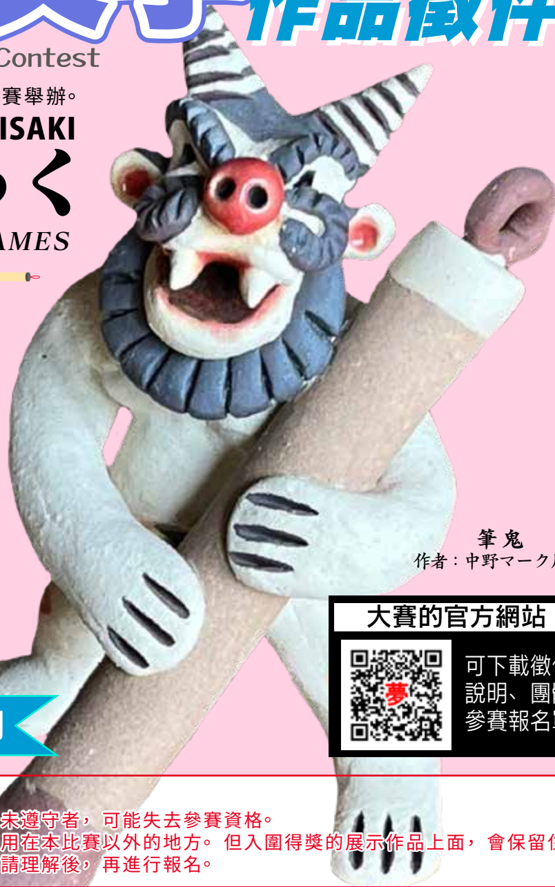
筆鬼 作者：中野マーク周作